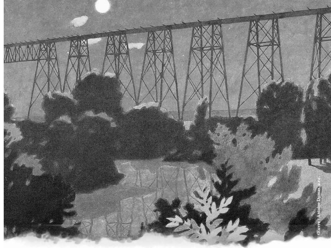
Œuvre : Antoine Dumas, A.R.C.

Conception et montage graphique du programme : Robert Levasseur